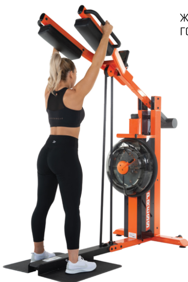
ЖИМ НАД ГОЛОВОЙ

Плечевые накладки и эргономичные рычаги позволяют сразу занять наиболее комфортное положение для эффективной тренировки без дополнительных сложных регулировок.